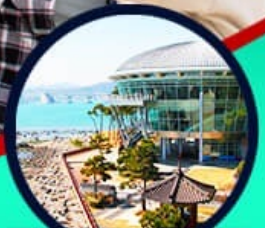
เอเปคเฮาส์ บูริมารู