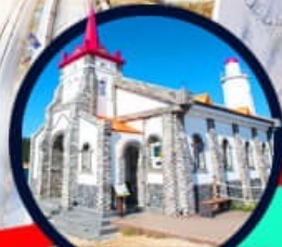
โบสถ์คริสต์จุกซอง