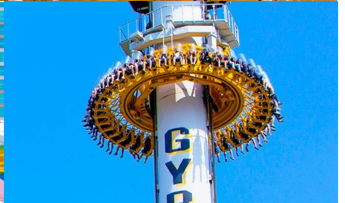
เที่ยง อีระอาหารกลางวัน ณ สวนสนุกล็อตเต้เวิลด์ (เพื่อให้ท่านได้สนุกอย่างเต็มที่)