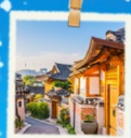
หมู่บ้านนุกซอน