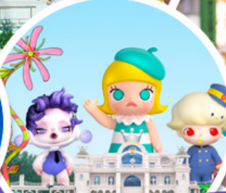
ช้อปบิง POP MART