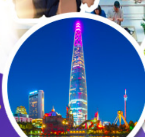
ตึกก็อตเต็มจลล์

• ช้อปบิง 6 แบนด์ดัง POP Mart / Carlyn / Stand Oil / Emis / Marithe / Mardi