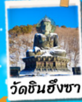
วัดชินฮังซา