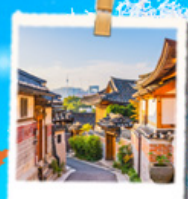
นุกซอนฮันอก