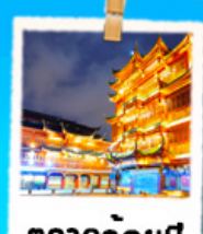
ตลาดร้อยปี