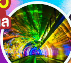
อู๋มอนด์เลเซอร์