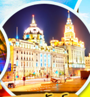
เดอะบันด์