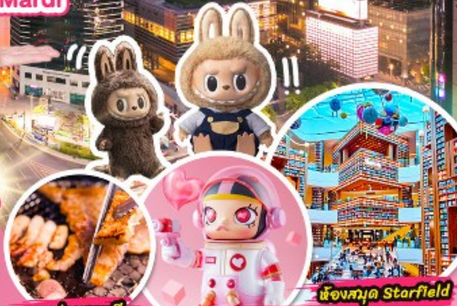
หมูย่างเกาหลี