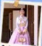
ใส่ชุดฮันบก