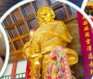
วัดเขากงเมี้ยว