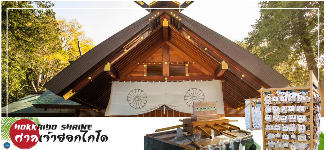
HOKKAIDO SHRINE ศาลเจ้าฮอกไกโด

จากนั้นนำท่านเดินทางสู่ เมืองซัปโปโร (SAPPORO) (ใช้เวลาเดินทางประมาณ 1.20 ชั่วโมง) นำท่านขอพร ศาลเจ้าฮอกไกโด (Hokkaido Shrine) หรือเดิมชื่อ ศาลเจ้าซัปโปโร เปลี่ยนเพื่อให้สมกับ ความยิ่งใหญ่ของเกาะเมืองฮอกไกโด ศาลเจ้าชินโตนี้คอยปกป้องรักษา ให้ชนชาวเกาะฮอกไกโดมีความสุขถึงแม้จะไม่ได้มีประวัติศาสตร์อันยาวนาน