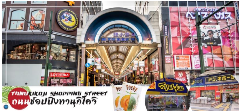
TANUKIKOJI SHOPPING STREET ถนนช้อปปิ้งทานุกิโจจิ

จากนั้นนำท่านสู่ ถนนช้อปปิ้งทานุกิโจจิ (Tanukikoji Shopping Street) เป็นย่านการค้าเก่าแก่ของเมืองซัปโปโร โดยมีพื้นที่ทั้งหมด 7 บล็อก ภายในนอกจากจะเป็นแหล่ง รวมร้านค้าต่างๆ อย่างร้านขายกิโมโน เครื่องดนตรี วิดีโอ โรงภาพยนตร์ แล้ว ยังมีร้านอาหารมากมาย ทั้งยังเป็นศูนย์รวมของเหล่าวัยรุ่นด้วย เนื่องจากมีเกมเซ็นเตอร์และตู้หยอดตุ๊กตามากมาย ร้านดองกิ ร้าน 100 เยน นอกจากนี้ที่นี่ยังมีการตกแต่งบนหลังคาด้วยตุ๊กตาทานุกิขนาดใหญ่ และเนื่องจากร้านค้าส่วนใหญ่มีหลังคาคลุม ดังนั้น ไม่ต้องกังวลเรื่อง ฝนหรือหิมะ ท่านสามารถช้อปปิ้งได้อย่างเพลิดเพลิน