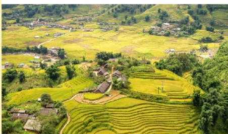
หมู่บ้านต้าฟาน