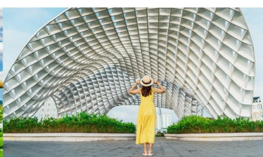
สวนเอเปค