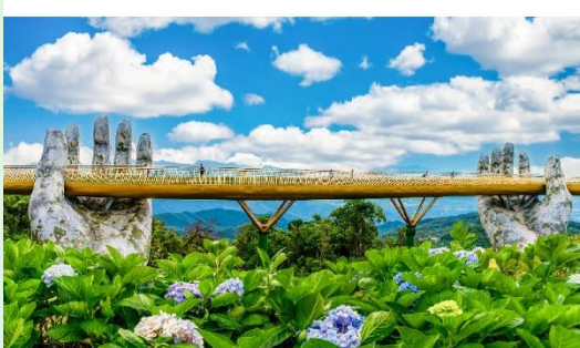
สะพานมือบานาฮิลล์