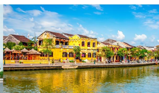
หมู่บ้านฮอยอัน

*กรณีห้องพักบานาฮิลล์เต็ม ขอสงวนสิทธิ์ในการเปลี่ยนวันเข้าพัก และปรับเปลี่ยนโปรแกรมโดยคำนึงถึงผลประโยชน์ลูกค้าเป็นสำคัญ