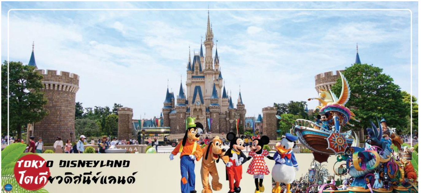
TOKYO DISNEYLAND โตเกียวดิสนีย์แลนด์