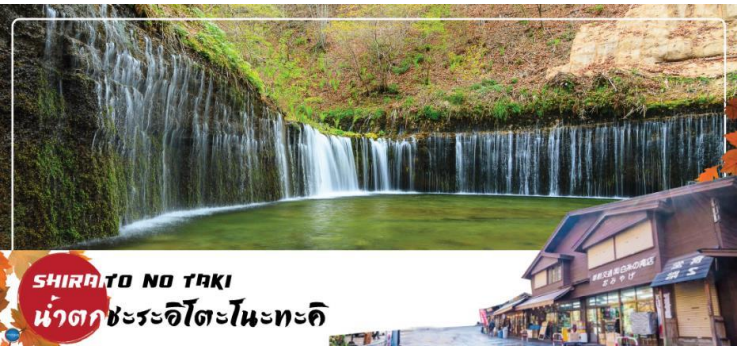
SHIRAITO NO TAKI น้ำตกชิระอิโตะโนะตะคิ

รับประทานอาหารกลางวัน ณ ภัตตาคาร (5) จากนั้นนำท่านสู่ น้ำตกชิราอิโตะ (Shiraito no taki) (ใช้เวลาเดินทางประมาณ 1.15 ชั่วโมง) เป็นน้ำตกตั้งอยู่ที่ เมืองฟูจิโนมียะ จังหวัดชิซุโอกะ เป็นส่วนหนึ่งของอุทยานแห่งชาติฟูจิซากาเนอิซุ ได้รับขึ้นทะเบียนเป็นมรดกโลกพร้อมกับภูเขาไฟฟูจิ อุทยานแห่งชาติฟูจิซากาเนอิซุ และทะเลสาบฟูจิทั้งห้าภายใต้ชื่อ "ฟูจิซัง สถานที่ศักดิ์สิทธิ์และแหล่งที่มาของความบันเทิงทางศิลปะ" เมื่อวันที่ 22 มิถุนายน ค.ศ.2013 น้ำตกชิราอิโตะถือเป็นน้ำตกที่ศักดิ์สิทธิ์ มีศาลเจ้าอาซามะตั้งอยู่ด้วยการไหลของสายน้ำที่แยกสายออกเป็นหลากร้อยเส้น ทำให้มองดูแล้วเหมือนกับเส้นด้ายสีขาว จึงเป็นที่มาของชื่อเรียกที่ว่า ชิราอิโตะ ที่แปลตรงตัวว่า ด้ายสีขาว นั่นเอง อีกทั้งที่นี่ยังมีเรื่องราวของการปฏิบัติธรรมในถ้ำที่เคยเกิดภูเขาไฟปะทุขึ้นมาด้วย จึงทำให้ผู้คนให้ความศรัทธากันว่าเป็นที่ชำระล้างจิตใจ และเป็นพื้นที่ศักดิ์สิทธิ์สำคัญของผู้แสวงบุญ จึงถือเป็นพาเวอร์สปอตอีกจุดหนึ่งในญี่ปุ่นที่สามารถชมฟูจิซังได้ในมุมที่ไม่เหมือนใคร เป็นน้ำตกและภูเขาไฟฟูจิตั้งอยู่ด้านหลัง และถือเป็นจุดชมใบไม้เปลี่ยนสีที่สวยงามมากอีกด้วย