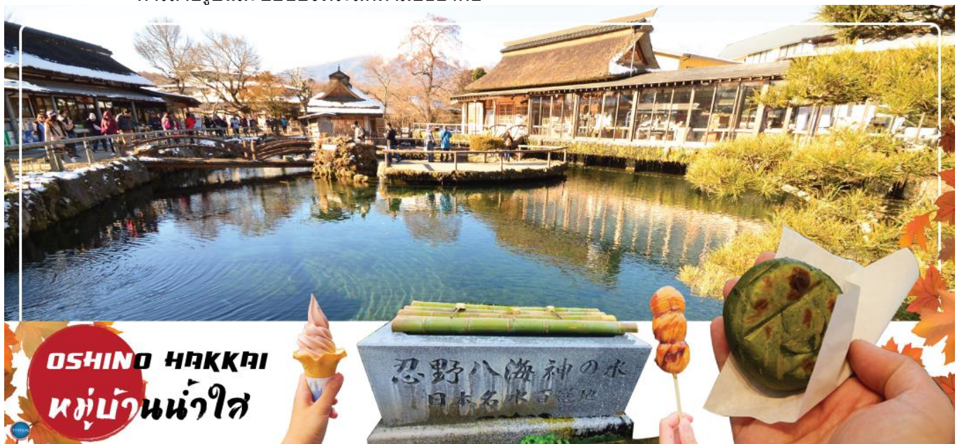
OSHINO HAKKAI หมู่บ้านน้ำใส

นำท่านชม หมู่บ้านโอชิโนะฮักไก (Oshino Hakkai) เป็นในช่วงฤดูใบไม้เปลี่ยนสีเป็นจุดท่องเที่ยวสำคัญอีกสถานที่หนึ่ง โดยมีวิวภูเขาไฟฟูจิสีขาวตัดกับพื้นหลังสีฟ้า และใบไม้เปลี่ยนสี สีเหลือง แดง ส้ม เป็นภาพที่สวยงามมาก โอชิโนะฮักไกเป็นหมู่บ้านเล็กๆ ประกอบด้วยบ่อน้ำ 8 บ่อในโอชิโนะ ตั้งอยู่ระหว่างทะเลสาบคาวากูจิโกะ กับทะเลสาบยามานาคาโกะ บ่อน้ำทั้ง 8 นี้เป็นน้ำจากหิมะที่ละลายในช่วงฤดูร้อน ที่ไหลมาจากทางลาดใกล้ภูเขาไฟฟูจิผ่านหินลาวาที่มีรูพรุนอายุกว่า 80 ปี ทำให้น้ำใสสะอาดเป็นพิเศษ นอกจากนี้ยังมีร้านอาหาร ร้านจำหน่ายของที่ระลึก และชมรอบๆบ่อ ที่ขายทั้งผัก ขนมหวาน ผักดอง งานฝีมือ และผลิตภัณฑ์ท้องถิ่นอื่นๆ อีสาระให้ท่านได้เพลิดเพลินกับการถ่ายรูปและซื้อของที่ระลึกตามอัธยาศัย