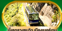
นั่งรถรางชมวิว เมืองเบอร์เกน