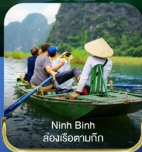
Ninh Binh ล่องเรือตามก๊ก