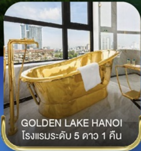
GOLDEN LAKE HANOI โรงแรมระดับ 5 ดาว 1 คืน