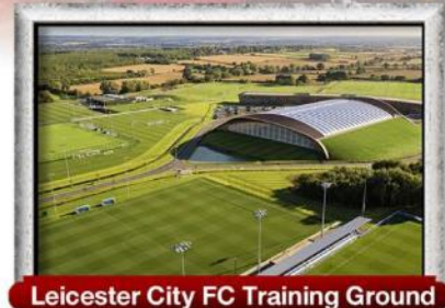
Leicester City FC Training Ground

พิเศษ!! เมนู เบอร์เกอร์ต้นตำรับ & กุ้งลือบสเตอร์ และ เปิดย่างไฟร์ชิลีน