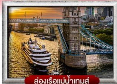
ล่องเรือแม่น้ำเทมส์