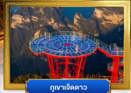
ภูเขาเจ็ดดาว