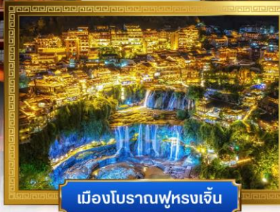
เมืองโบราณฟูหลงเจิ้น