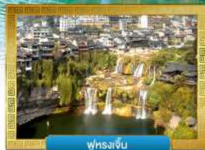
พูหงเจิน