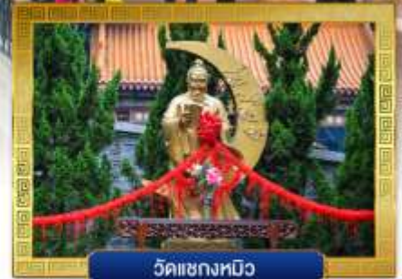
วัดเซ่งหมีง