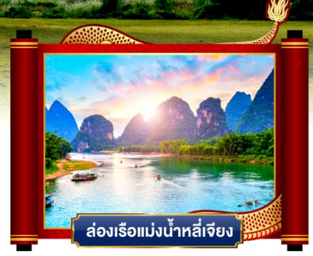
ส่องเรือแม่น้ำหลู่เจียง