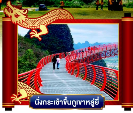
นั่งกระเช้าขึ้นภูเขาหลู่ยี่