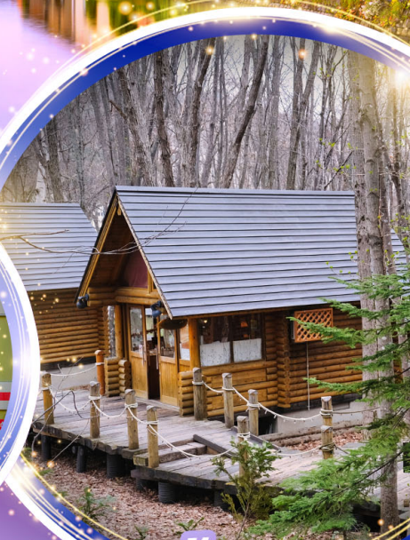
นิงเกิ้ลทอเรีย