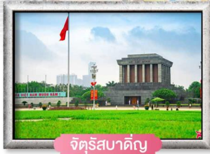
จัตุรัสบาติญ