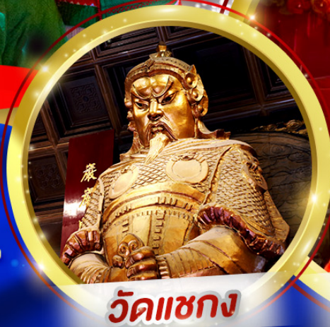
วัดเซกวง