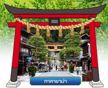
ทาคายามา