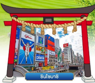
ชินโซบาชิ