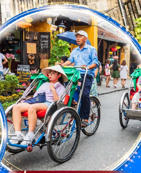
นั่งรถสามล้อไซโคล

พักบน บานาฮิลล์ 1 คืน นั่งกระเช้าที่ยาวที่สุดในโลก ขึ้นสู่บานาฮิลล์ ชมเมือง ฮอยอัน เมืองมรดกโลกที่สวยงามและเจียบสงบ พิเศษ!! บุฟเฟ่ต์นานาชาติ บานาฮิลล์