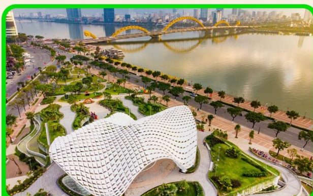
เช็คอิน แหล่งที่เที่ยงใหม่ APEC PARK