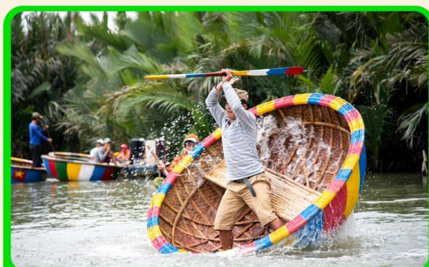
พิเศษ !!! นั่งเรือกระดัง UNSEEN เวียดนาม