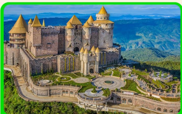
เที่ยวบานาฮิลล์แบบจุใจ เต็มวัน