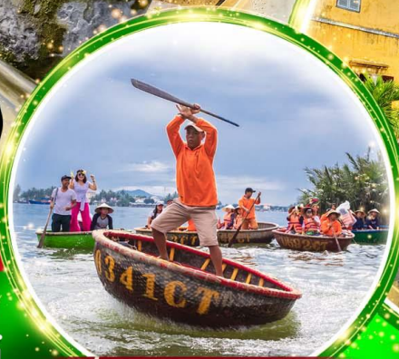
นั่งเรือกระดิง Hoi an