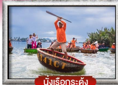
นั่งเรือกระดิง