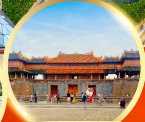
พระราชวังโบราณไดโนย