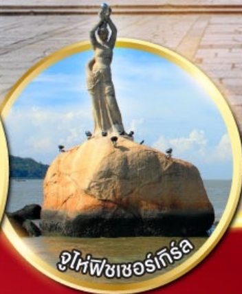
จูไห่พีซเซอร์กิส