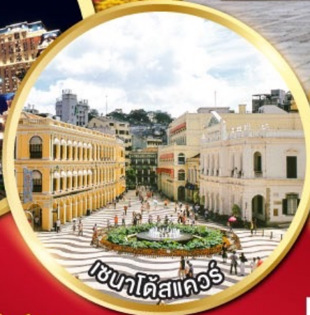
เวเนตัสแมคเก๊า