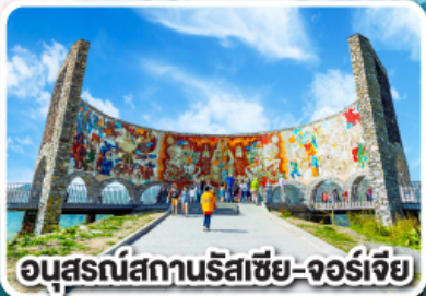
อนุสรณ์สถานริสเซีย-จอร์เจีย