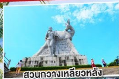
สวนหลวงเหลียวหลิง