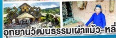
อุทยานวัฒนธรรมเผ่าแม้ว-หลี