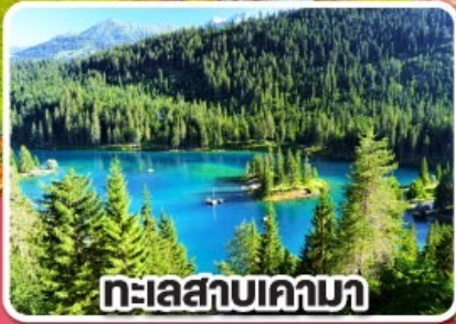
ทะเลสาบเคามา

เกาะดอกไม้ รถไฟธรรมชาติและมหาน้ำแข็ง สวิตเซอร์แลนด์ เยอรมนี 8 วัน 5 คืน