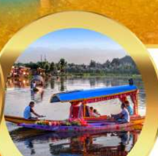
ล่องเรือซิคาร์่า