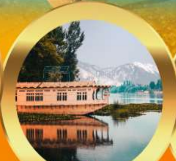
นอนบ้านเรือ วิวเขาหิมาลัย