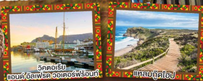
วิกตอเรีย แอนด์ อัลเฟรด วอเตอร์ฟรอนท์

เปิดประสบการณ์กับทัศนคาร Canivore สวรรค์ของคนรักเนื้อสัตว์