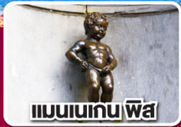
แมนเนเกน ฟิส

ฝรั่งเศส เบลเยียม ลักเซมเบิร์ก เยอรมนี เนเธอร์แลนด์ 8 วัน 5 คืน