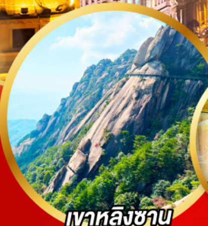
เงาหลิงซาน