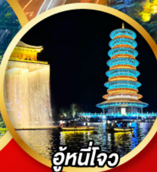
อู๋หนี่โจว