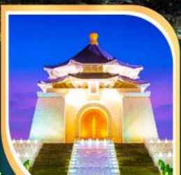
เจียงโกเชิก