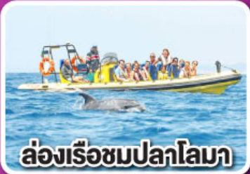
ล่องเรือชมปลาโลมา