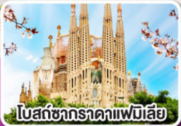
โบสถ์ซากราตาแฟมิเลีย