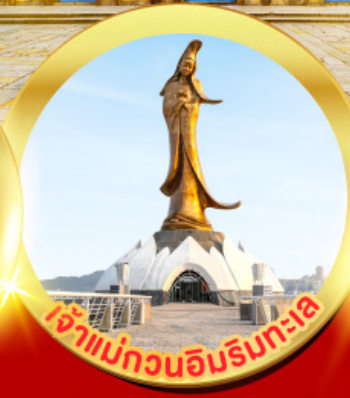
เจ้าแม่กวนอิมรับทะเล