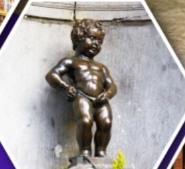
แมนเกินฟิส