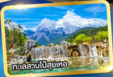
ทะเลสาบไป๋สฺยฺเหอ