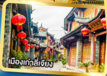
เมืองเก๋าลี่เจียง