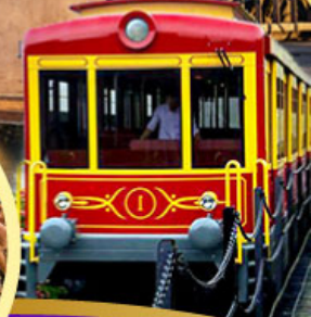
เริ่มต้น