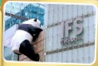
หมีแพนด้ายักษ์ปิ่นตึกถนนซุนซี