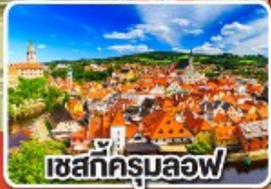
เชสท์ครุมลอฟ