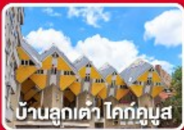
บ้านลูกเต่า โคก์กูมูส