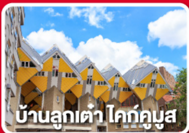
บ้านลูกเต่า โคกกุบูน