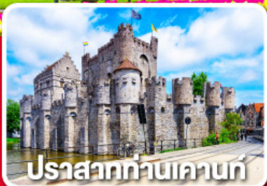
ปราสาทท่านเคานท์