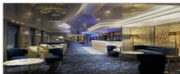
Princess Live! Café