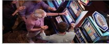
Vegas Style Casino