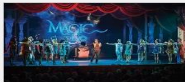
Original Musical Productions