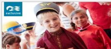
Discovery at SEA Programs