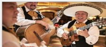
Music & Dancing