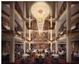
MAIN DINING ROOM

Royal Caribbean offers a myriad of casual dining options and quick bites for meals on the run.