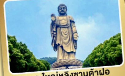
พระใหญ่หลิงซานต้าฝอ

เมนูพิเศษ! ซีโครงหมูอู๊ชิ, เสี่ยวหลงเปา, ชาบูหมาล่า