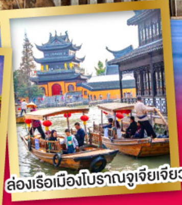
ล่องเรือเมืองโบราณจูเจียเจียว